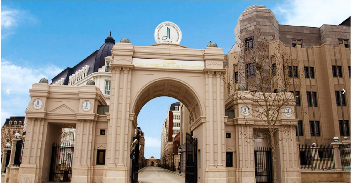
ANKARA MÜZİK VE GÜZEL SANATLAR ÜNİVERSİTESİ

Öğrencilerimizin müzik ve güzel sanatlara olan ilgisini Ortaöğretim Genel Müdürlüğü olarak güçlü bir şekilde destekliyoruz. Bu kapsamda Ankara Müzik ve Güzel Sanatlar Üniversitesi ile ortak çalışmalar yürütmekteyiz.